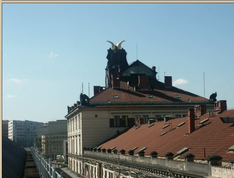
celkový pohled k jihu