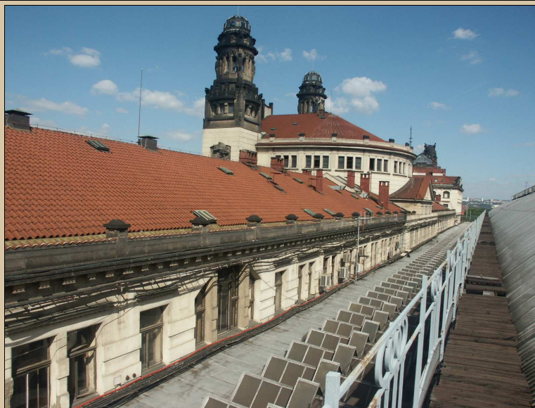
celkový pohled k severu

zachovat na původním místě beze změny, velmi šetrně očistit, v případě nutnosti konzervovat a hydrofobizovat či kamenicky doplnit. Pískovec bude restaurovat restaurátor s licencí MK ČR. Provést omytí kamenného prvku, odstranění nesoudržných spár. Doplnění kamenné výzdoby umělým kamenem shodné struktury jako stávající kámen. Provést patinu shodně jako je provedena na části C v roce 2016. Podrobný popis návrhu je uveden v restaurátorském průzkumu a záměru. Viz technologický postup TP/107.